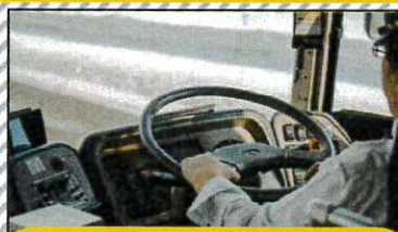
【免許の例】 大型自動車第二種免許