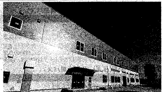
※新築校舎外観：令和8年竣工前 令和7年12月10日撮影