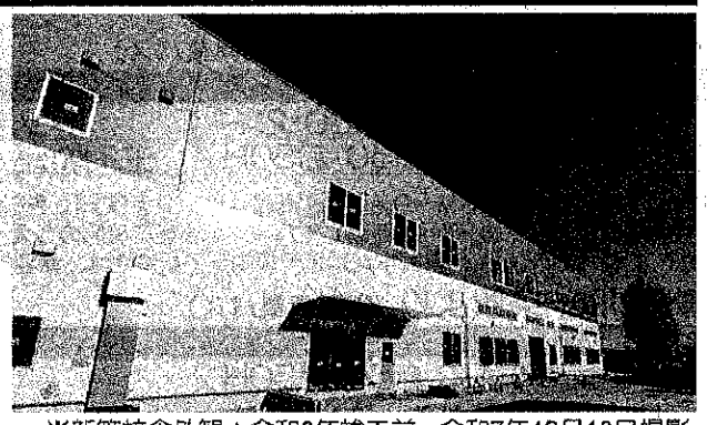
※新築校舎外観：令和8年竣工前 令和7年12月10日撮影

赤羽校 新築校舎へ移転 赤羽校は、令和8年3月に近隣(約400m)の新築校舎へ移転いたしました。 ➡ 詳細は裏面をご参照ください。