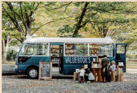
古書販売を中心に据えつつ、「本」をめぐる様々なステークホルダーの課題に着目。社会・環境・業界の持続可能性に貢献するユニークな事業を展開する。2024年10月、事業を通じ社会に貢献する企業に対する国際認証「B Corp™」取得。