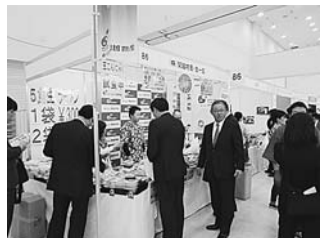
豊島産協会員企業の活動風景

今年も100企業・団体が109のブースに出展し活動を展開した。会期中は19,102人が来場したが、企業関係者や区民のみならず、小中学生も校外活動の一環として来場し、「工芸体験コーナー」などは貴重なキャリア教育の場としても活用された。