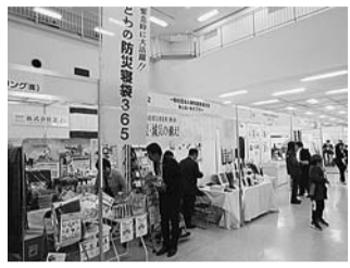
練馬産業連合会の合同ブース風景

各ブースでは多くの来場者、出展者と交流し情報やアイデアの収集、販路開拓に成果があった。出展した会員企業にとっても、こうした場での来場者との触れ合いは別の意味で「ものづくり」に対する意識啓発「製品開発に対するヒントの獲得」「次回への出展に向けた課題の明確化」など良い刺激が受けられ、成果の多い活動であったと評価しており、ものづくり基盤技術の強化に向け更なる活動を期待したい。