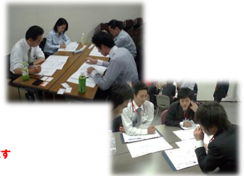
※グループワーク形式で、同じ立場の別会社の方と意見交換が行え、多くの気付きを得ることが可能

本研修のお申込み先：以下お問い合わせ欄に必要事項を明記頂き、切り取らずにFAXにて送信下さい FAX番号：03-3546-2853