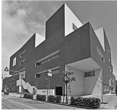
城東職業能力開発センター