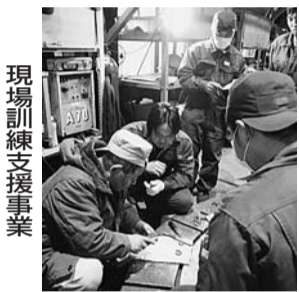
現場訓練支援事業

【江戸川校 訓練科目】 ①一年コース ・機械加工科 ・自動車整備工学科 ・メカトロニクス科 ②一年コース ・環境分析科 ③六か月コース ・介護サービス科